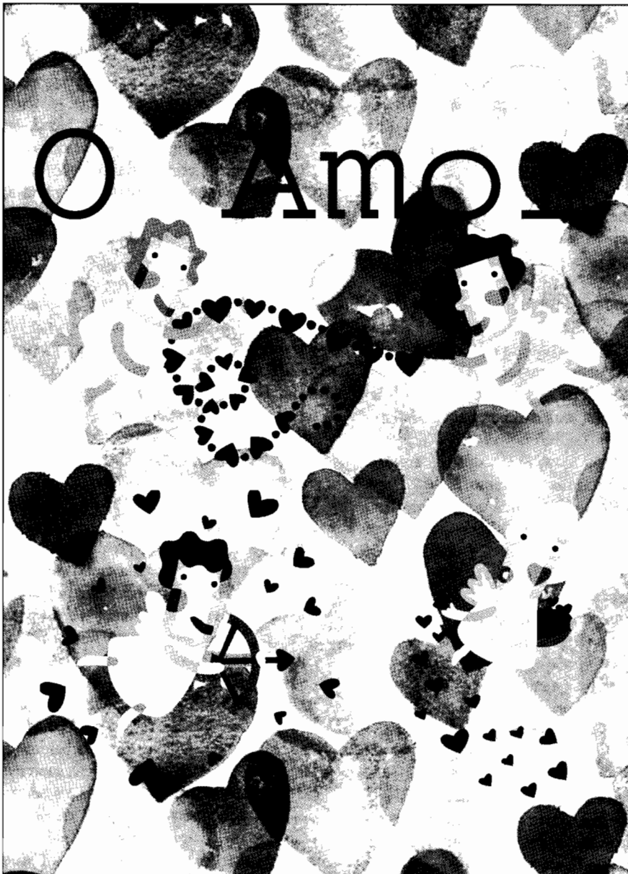
Trabalho proposto pelo professor da disciplina de Educação Moral Religiosa e Católica da turma do 9ºano A numa pesquisa sobre o tema “ O Amor ”.

Cresci e mudei. Os problemas enfrentarei! Com cabeça levantada vou seguir, E continuar sempre a sorrir!