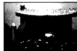
Terceiro – Patrícia 5ºB